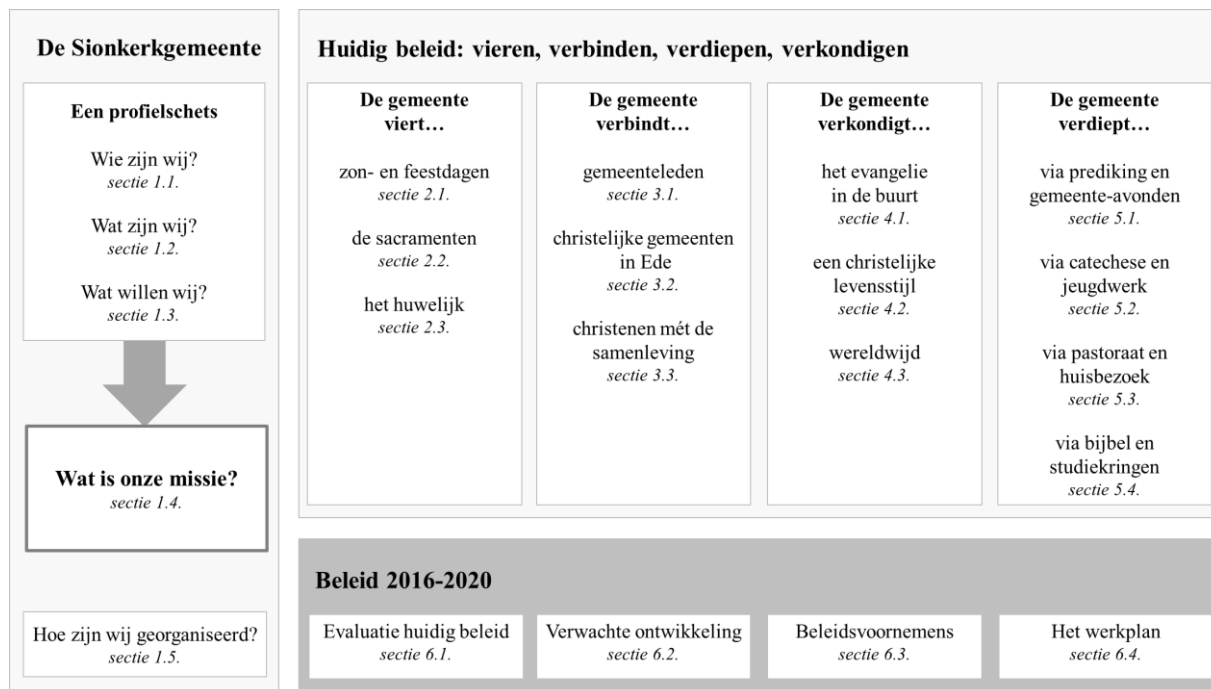
Figuur 1. Schematische opzet van het beleidsplan Sionkerk gemeente 2016-2020.

Dit beleidsplan bestaat uit drie onderdelen (zie Figuur 1). Na dit voorwoord wordt er in hoofdstuk 1 een profielschets gegeven van de Sionkerk gemeente: wij presenteren onszelf en geven een positionering van ons als christelijke gemeente. Uit deze visie volgt wat wij als gemeente belangrijk vinden (onze missie). In de hoofdstukken 2 tot 5 wordt onze missie onderbouwd en aangegeven hoe onze gemeente haar roeping concreet maakt of wil maken via prediking, pastoraat en andere activiteiten (het huidige beleid). In hoofdstuk 6 wordt het huidige beleid kort geëvalueerd en wordt ingegaan op verwachte ontwikkelingen in kerk en samenleving. Hierop volgen de beleidsvoornemens voor de komende jaren én de concrete uitwerking daarvan in het werkplan.